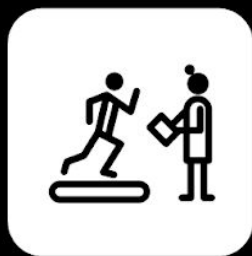
Programa de acondicionamiento físico